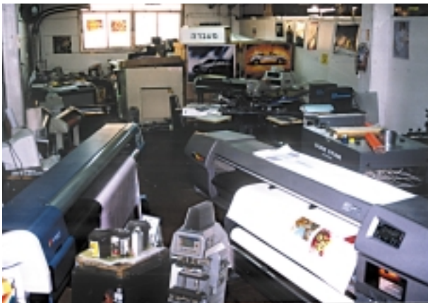
ארטא מחלקת מחשבים - לזחב 2 את החדש ראשליצ