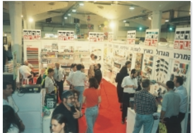
חוזרים לבית הספר עם ארטא

לחברת ארטא אוספיון אקולוגי המונה כ- 20,000 איש, אשר מקבלים עדכונים שוטפים ע"י דיוור ישיר הכולל מבצעים, מתנות ועוד... החברה מרעננת את המועדון ומצרפת כל הזמן לקוחות חדשים.