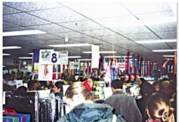
המכירה המסורתית של סוף השנה

מידי שנה בסוף דצמבר ארטא עורכת ברשת סניפיה את המכירה המסורתית של השנה בהנחה ענקית לאלפי סטודנטים, אמנים, מעצבים ולקוחות נוספים.