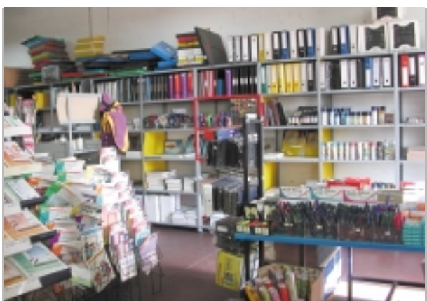
ארטא חנות המפעל - לזרוב 2 א.ת. החדש ראש"צ