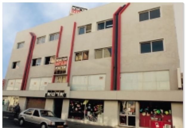
ארטא חנות ראשית - נחלת בנימין 83

אמנות, גרפיקה, עיצוב, מכשירי כתיבה, ציוד משדרי, מוצרי פופ, ציוד לשרטוט והנדסה, אדריכלות, הובי ומלאכת יד, ציוד לענף האלקטרוניקה, מחשבים, רוטט משדרי, ציוד לבתי דפוס ותעשיית דפוס המשי, שלוט, ציוד להדפסה מתוחכמת, לייזר דפוס וחיתוך, פלוטרים ומדפסות לדפוס וחיתוך, כרסומות ועוד.