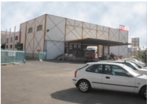
ארטא המרכז הלוגיסטי - לזרוב 2 א.ת. החדש ראש"צ

לאחרונה בעקבות גידול עצום בהיקף הפעילות של ארטא וכן הזכייה במכרז לאספקה בלעדית של כל הציוד המשדרי והמתכלים לתעשייה האווירית לארבע שנים, החליטה חברת ארטא על מעבר ל מרכז לוגיסטי חדש מחוץ לעיר ת"א ברחוב: לזרוב 2, באזור התעשייה החדש של ראשון לציון.